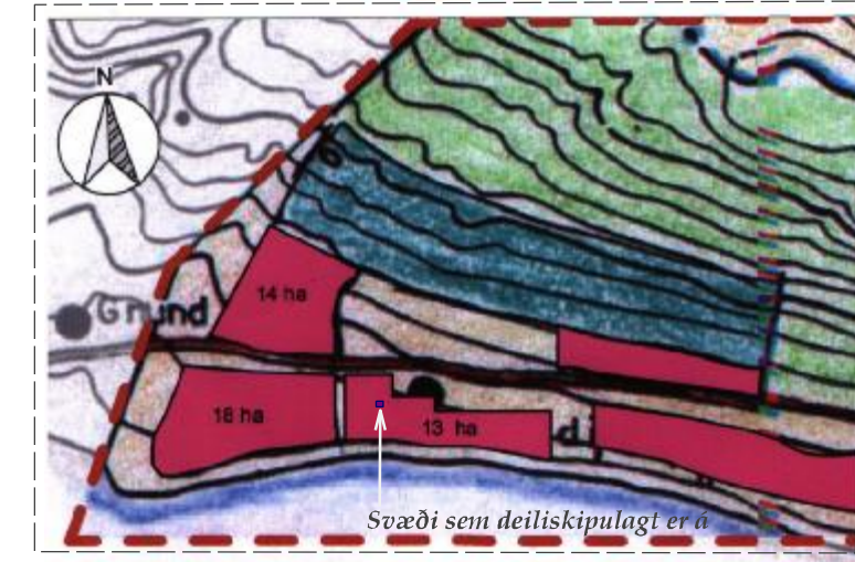
Staðfest svæðaskipulag norðan Skarðsheiðar 1997-2017 Mælikvarði 1:30.000 ekki nákvæmur.