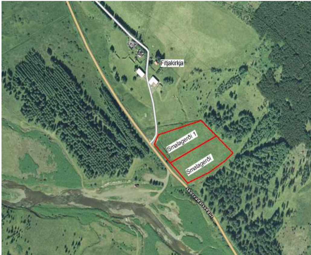
Mynd 1 Yfirlitsmynd af staðsetningu skipulagssvæðisins.

verður ofarlega í hlíðinni fjær Fitjum. Byggingareitur Fitja-Smalagerðis 1 verður nokkru neðar í hlíðinni nær Fitjum.