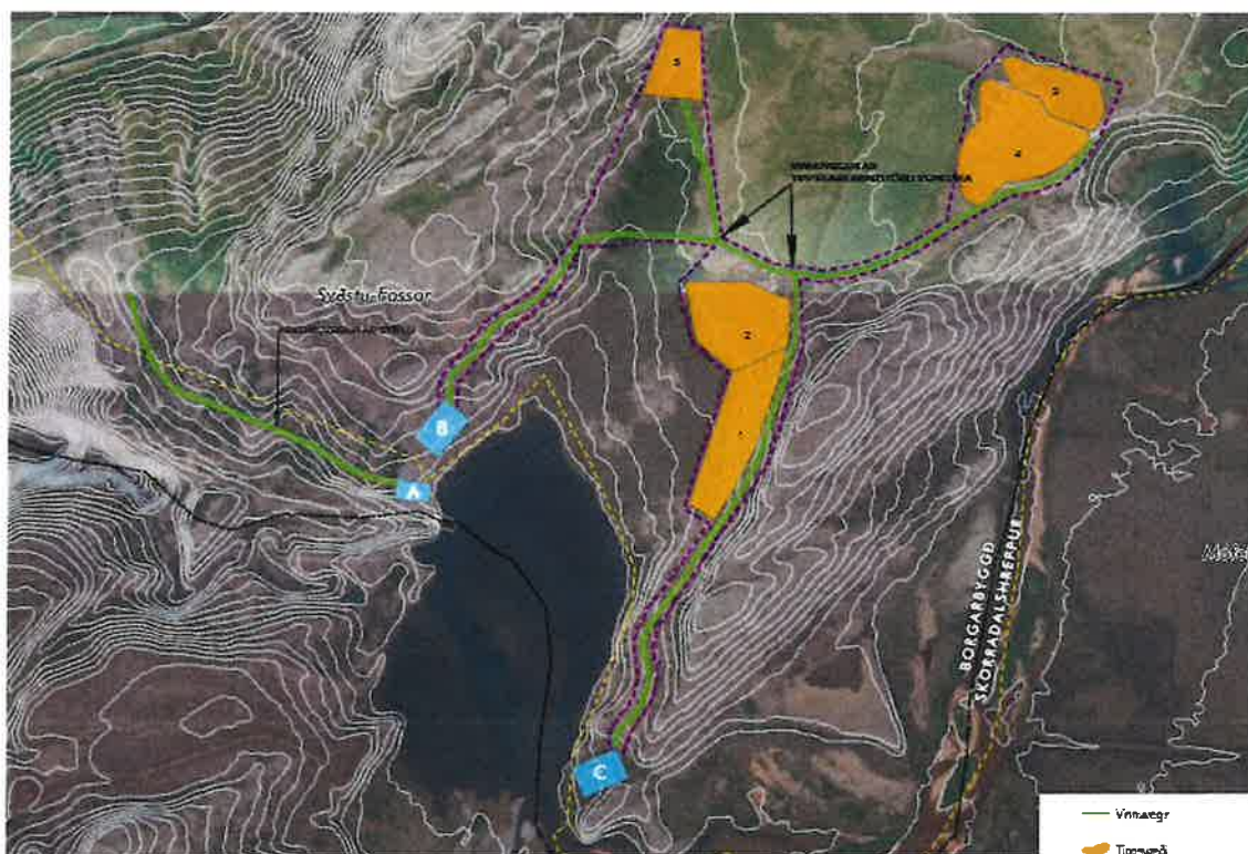
Kort nr. 2 sem er undir fylgiskjöllum 1 í framkvæmdaleyfisumsókn