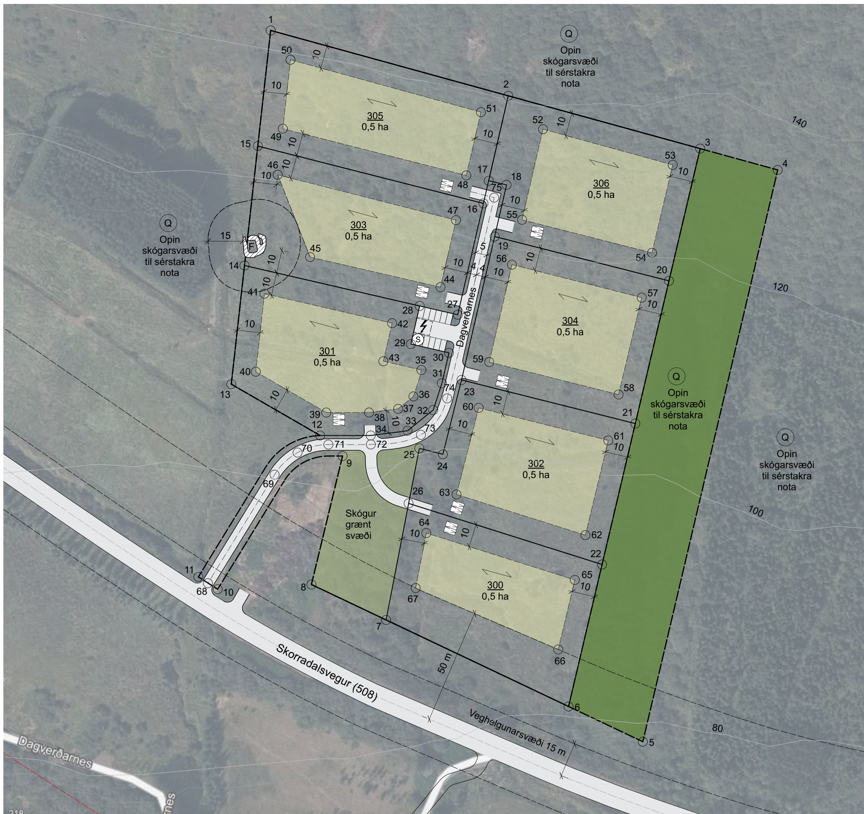
DEILISKIPULAGSUPPRÁTTUR SVÆÐI 9 MKV. 1:1000